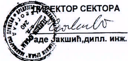
Прилог: Списак овлашћених запослених лица

Digitally signed by Rade Jakšić 100049085-2102968810051 DN: dc=rs, dc=posta, dc=ca, ou=Pravno lice (PL), ou=Preduzeće za telekomunikacije Telekom Srbija a.d. 17162543, cn=Rade Jakšić 100049085-2102968810051 Date: 2016.03.24 14:22:18 +01'00'